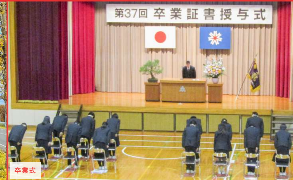
第37回卒業証書授与式