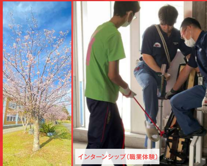
インターンシップ(職業体験)