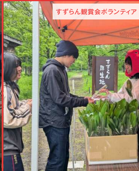
すずらん観賞会ボランティア