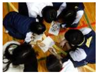
謎トキトキ♥ お宝ガッポガッポ♥