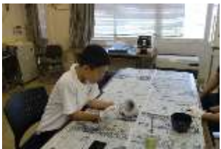
指紋採集を体験しました。 （門別警察署）