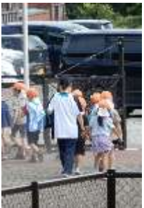
子供たちを見守りながら、一緒に遊びました。 （ハチラー保育園）