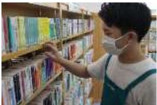
本の整理などを行いました。 （平取町立図書館）

職業について理解を深め将来の職業選択に役立てることに、社会人としてのマナーやスキルを身につけることが目的です。今年も各事業所等のご協力をいただき、実りある実習を行うことができました。