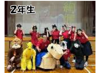
2年生 細部にこだわった本格的自作動画とバラエティに富んだダンスを披露