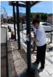
バス停の清掃を行いました。 （平取町役場まちづくり課）