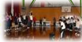
学校祭前日に3年生のサプライズイベントで全校生徒が熱唱