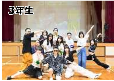
3年生 息の合ったクオリティーの高いダンスパフォーマンスで会場全体を盛り上げてくれました！！