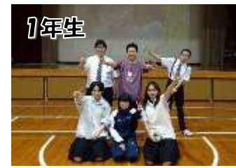
1年生 日々の高校生活を感じさせる自作動画とユーモア溢れる漫才を発表