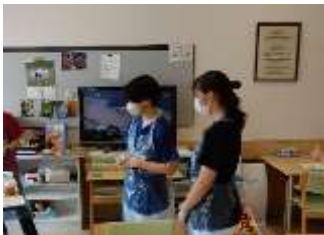
看護の実習体験を行いました。 （平取町国民健康保険病院）