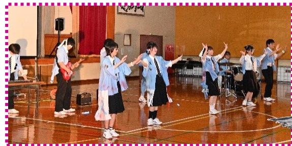
自作動画に生演奏と、新風を吹き込んだ1年生