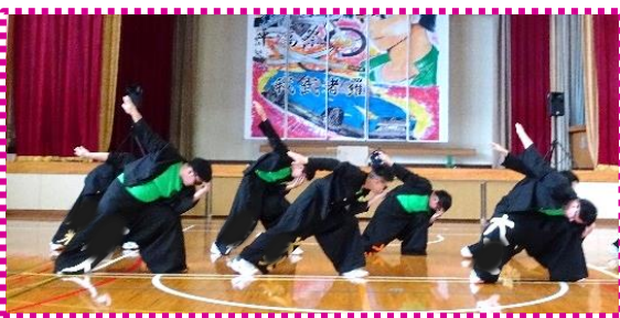
頑張った衣装で最後のポーズもキメた2年生 (画像一部加工)