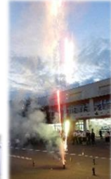
フィナーレは花火