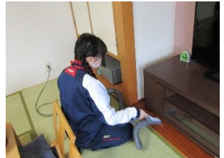
丁寧に客室の清掃を行いました （びらとり温泉ゆから）