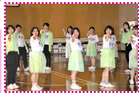
全員がアイドルになりきった3年生